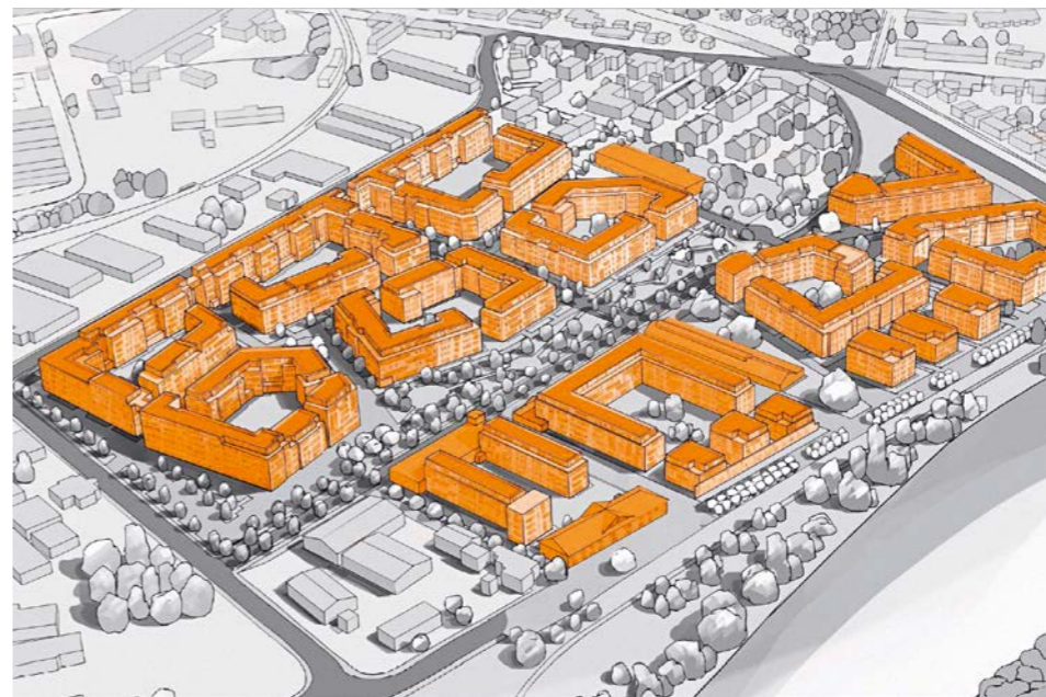
Informationen auf main-au-quartier.de